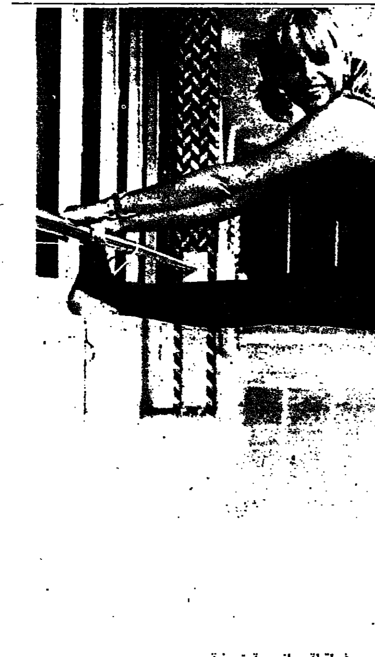
في لحظة رياضية ترفيهية